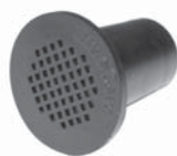
カーボンフィルター