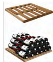
ユニバーサル貯蔵棚 (SU) 収容本数目安 77 本* ※重量 100kg まで