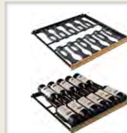
ソムリエの手引き出し棚 (CS) 収容本数目安 12 本*