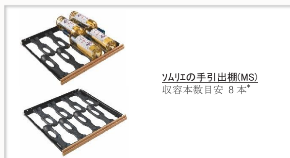
ソムリエの手引き出し棚(MS) 収容本数目安 8本*