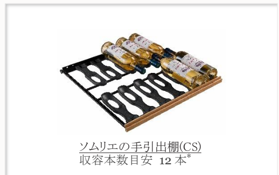
ソムリエの手引き出し棚(CS) 収容本数目安 12 本*