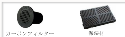
カーボンフィルター