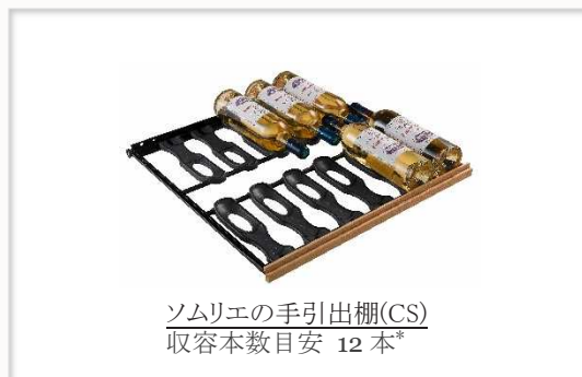
ソムリエの手引き出し棚(CS) 収容本数目安 12本*