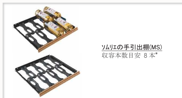
ソムリエの手引出し棚(MS) 収容本数目安 8 本*