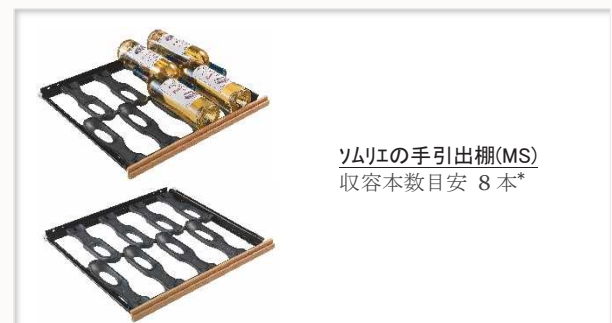
ソムリエの手引き出し棚(MS) 収容本数目安 8本*