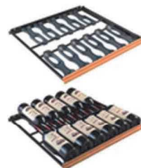
ソムリエの手引き出し棚(CS) 収容本数目安 12本*