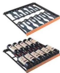
ソムリエの手引き出し棚(CS) 収容本数目安 12 本*