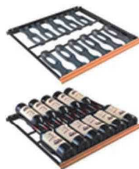
ソムリエの手引き出し棚(CS) 収容本数目安 12本*