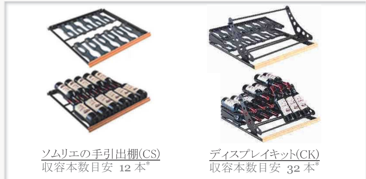
ソムリエの手引出し棚(CS) 収容本数目安 12 本*

ソムリエの手引き出し棚(CS): 6 枚 ディスプレイキット(CK): 2 セット