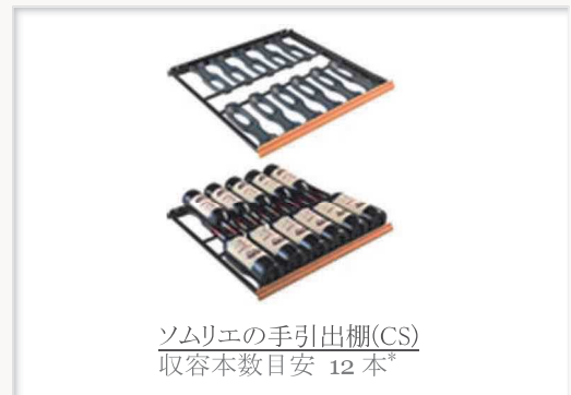
ソムリエの手引出し棚(CS) 収容本数目安 12 本*