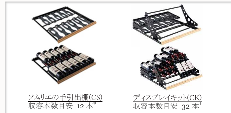
ソムリエの手引出棚(CS) 収容本数目安 12 本*

ソムリエの手引き出し棚(CS): 6 枚 ディスプレイキット(CK): 2 セット