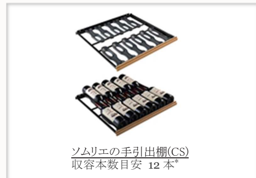
ソムリエの手引き出し棚(CS) 収容本数目安 12 本*