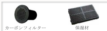
カーボンフィルター