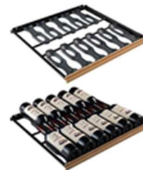
ソムリエの手引き出し棚(CS) 収容本数目安 12本*