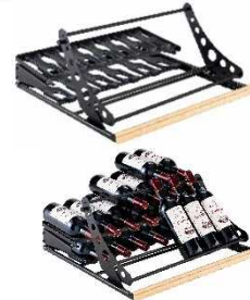
ディスプレイキット(CK) 収容本数目安 32 本*