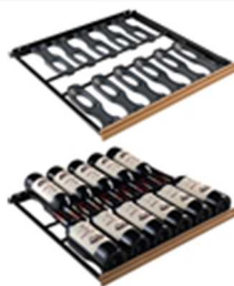
ソムリエの手引き出し棚(CS) 収容本数目安 12 本*

ソムリエの手引き出し棚(CS) : 6 枚 ディスプレイキット(CK) : 2 セット