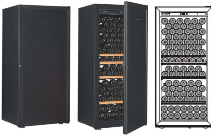
Première -M-T-STD (黒)