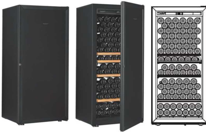
Première -M-T-STD (黒)