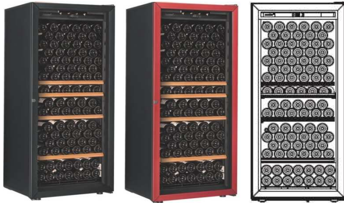
Première -M-T-PTHF (黒) Première -M-T-PTHF (赤) 収容本数目安 169 本