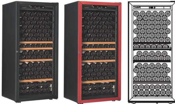
Première -M-T-PTHF (黒) Première -M-T-PTHF (赤) 収容本数目安 169 本