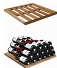
貯蔵棚(SU) 収容本数目安 77 本* ※重量 100kg まで