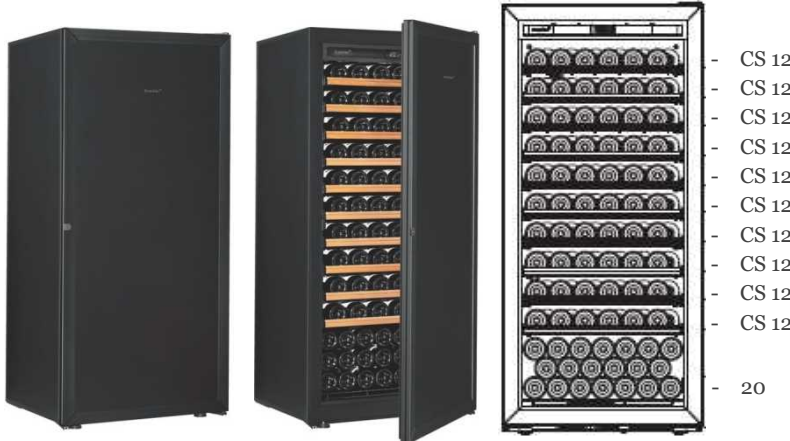
Première -M-C-STD (黒)