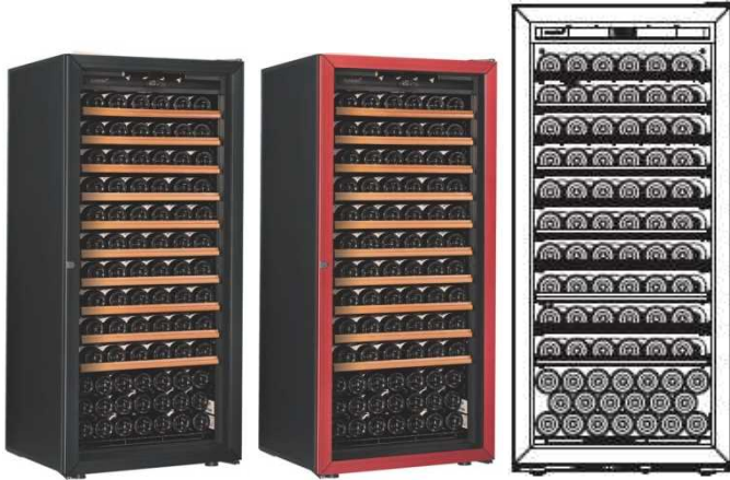
Première -M-C-PTHF (黒) Première -M-C-PTHF (赤) 収容本数目安 140本