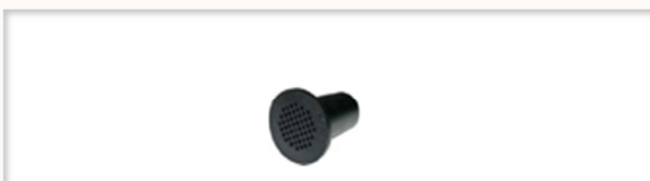
カーボンフィルター