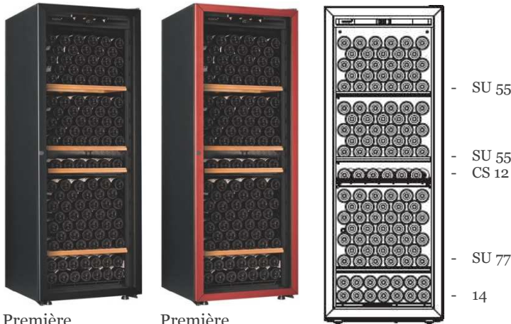
Première -L-T-PTHF (黒) Première -L-T-PTHF (赤) 収容本数目安 213本