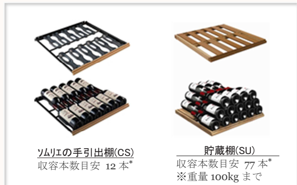
ソムリエの手引き出し棚(CS) 収容本数目安 12本*