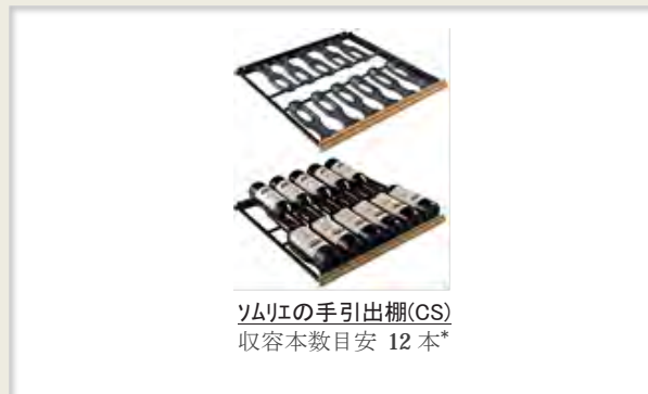
ソムリエの手引出棚(CS) 収容本数目安 12 本*