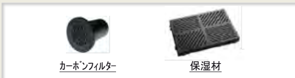
カーボンフィルター

カーボンフィルター : 交換目安 1 年(本体に 1 個付属) 保湿材 : 交換目安 2 年(本体に 1 個付属)