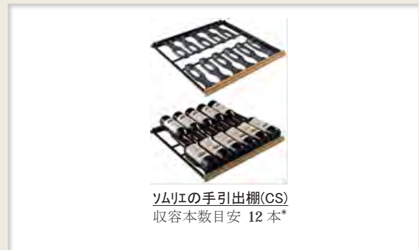
ソムリエの手引き出し棚(CS) 収容本数目安 12 本*