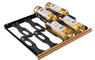
やわらかい材質でワインを振動から守る 引き出し棚 ソムリエの手 (MS)

庫内を一定温度に保つタイプです。 10～14℃設定で貯蔵用に、8℃設定で白ワインサービス用、18℃設定で赤ワインサービス用にもお使いいただけます。