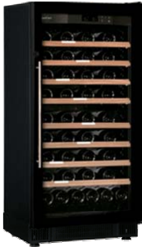
V159M-PTHF (ガラスドア) (税別) ¥ 490,000 (税込) ¥ 514,500