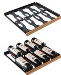
ソムリエの手引出し棚(MS) 収容本数目安 8本*