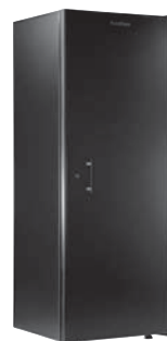
標準ドア(STD) カラー:ネロ